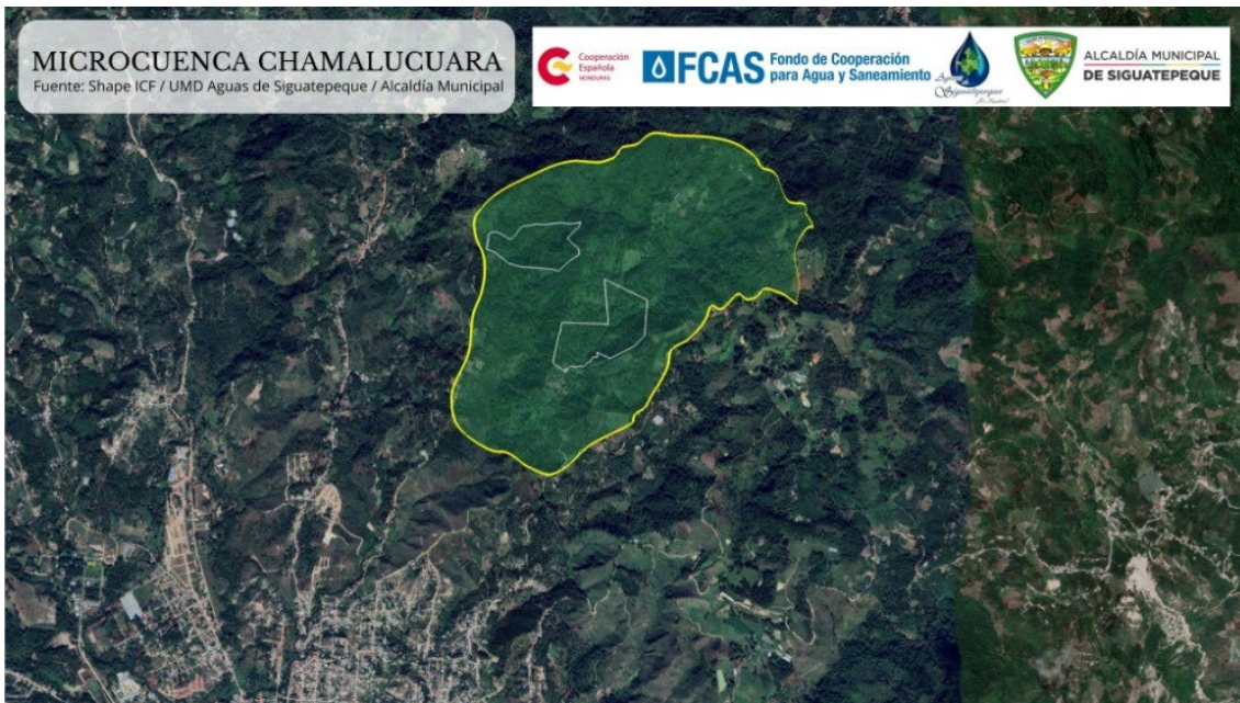
Imagen 2 Ubicación geográfica microcuenca Chamalucuará.

En la zona de abastecimiento, existe presencia de actividades de deforestación y expansión de la frontera agrícola, ocasionando un deterioro progresivo de la microcuenca. De tal forma, el prestador de servicio UMD Aguas de Siguatepeque realiza acciones de monitoreo encaminadas a la protección y conservación de la microcuenca, cabe mencionar que dentro de los límites de esta microcuenca UMD Aguas de Siguatepeque posee dos terrenos alrededor de 36.17 hectáreas.