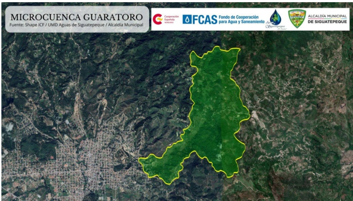
Imagen 3 Ubicación geográfica microcuenca Guaratoro.

abastecidos por UMD Aguas de Siguatepeque. Esta zona, está siendo afectada por la deforestación, expansión de la frontera agrícola, establecimientos de porquerizas, asentamientos humanos, cultivos de café y granos básicos, entre otros factores. Dentro de los límites de la microcuenca se abastecen comunidades del municipio de Siguatepeque y El Rosario, dichas comunidades se deberán de identificar con sus respectivas Junta de Agua, para que formen parte del proceso de elaboración del Plan de Ordenamiento y Manejo.